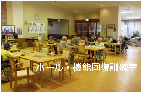
ホール・機能回復訓練室

住み慣れた家で、健康で自立した快適な生活が送れますよう、私たちデイサービスセンターが応援します。