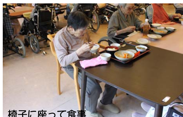
椅子に座って食事