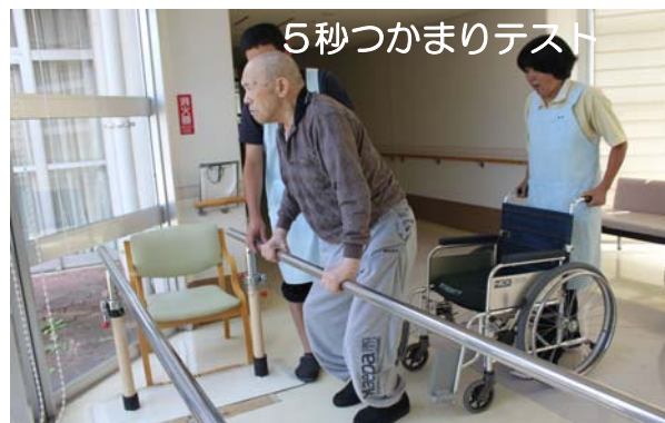
5秒つかまりテスト

サービスに関わる職員のチームワークで一人でも多く、トイレで排便ができる方や下剤を使用しなくても自然排便出来る方、歩行ができる方を増やしていきたいと思っております。