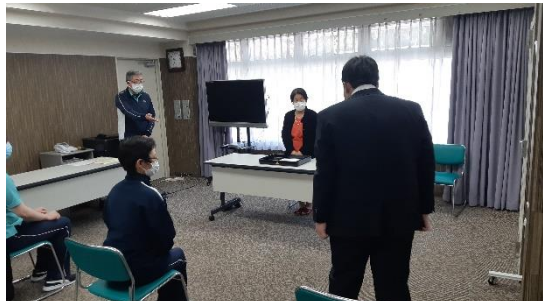
法人本部 会議室 (輪島市三井町小泉上野 2 番地にて)

令和 3 年 4 月 1 日採用の介護職員の入職式が行われました。理事長より採用者に辞令が交付され採用者の紹介が行われました。その後、安全衛生委員 5 名の委嘱状交付、永年勤続表彰（10 年、20 年、25 年、30 年、35 年勤続）が行われ、最後に表彰者を代表して謝辞がありました。皆さん今後も体に気をつけて頑張ってください。