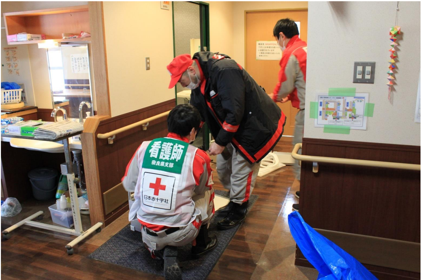
「デイサービス」再開の準備のため、簡易トイレの設置を DMAT の方にお願いいたしました(日本財団協力)