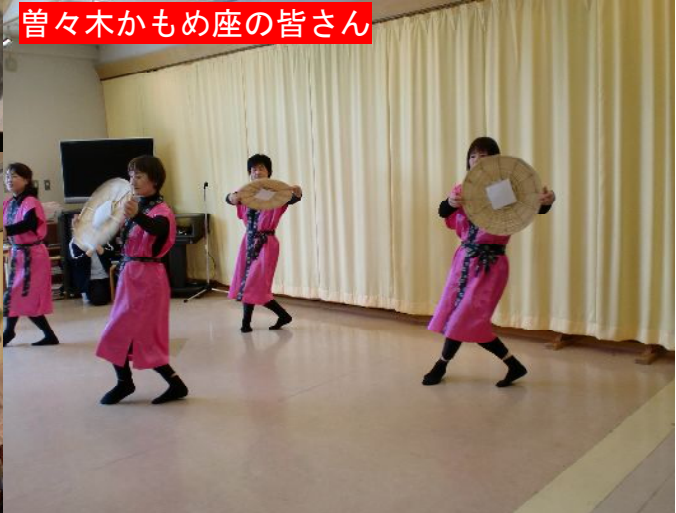
4月21日（木曜日）にて・穴水町民謡会