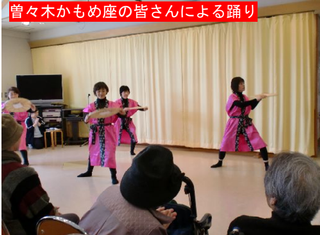
曾々木かもめ座の皆さん