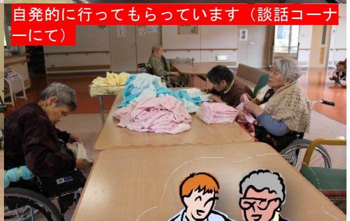
自発的に行ってもらっています（談話コーナーにて）