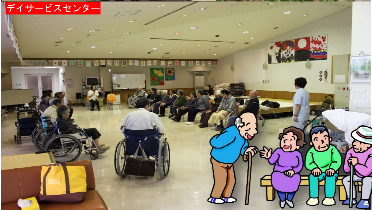
デイサービスセンター