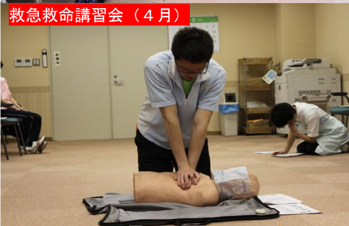
救急救命講習会（4月）