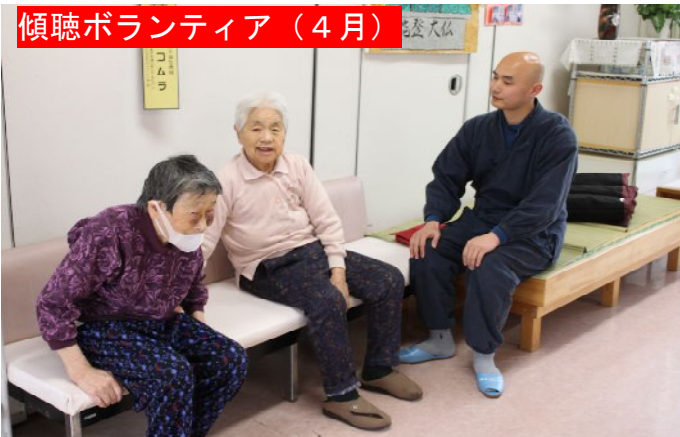
傾聴ボランティア（4月）