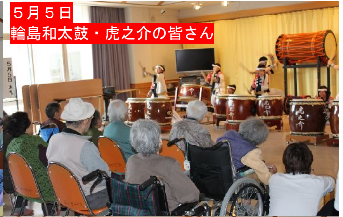
5月5日 輪島和太鼓・虎之介の皆さん