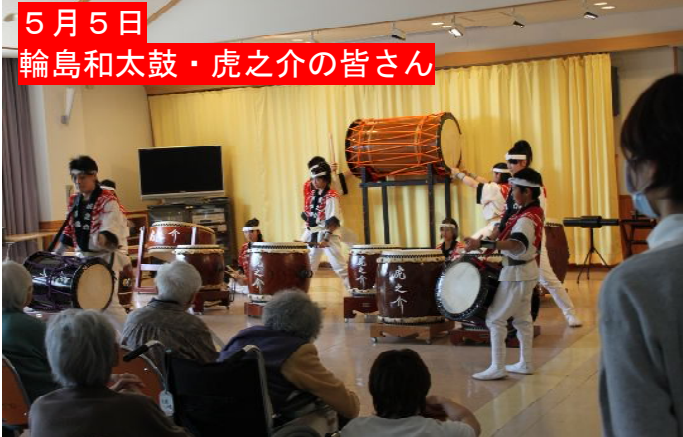
5月5日 輪島和太鼓・虎之介の皆さん