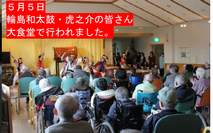
5月5日 輪島和太鼓・虎之介の皆さん 大食堂で行われました。