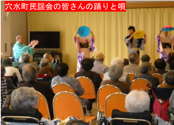
穴水町民謡会の皆さんの踊りと唄