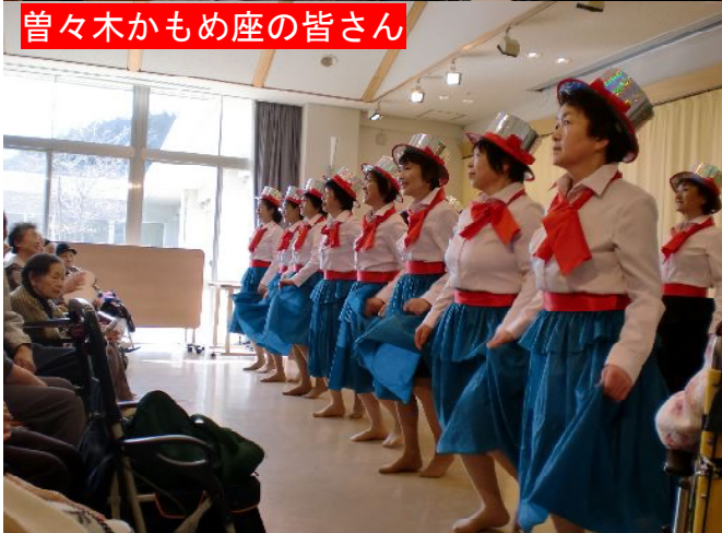
曾々木かもめ座の皆さん