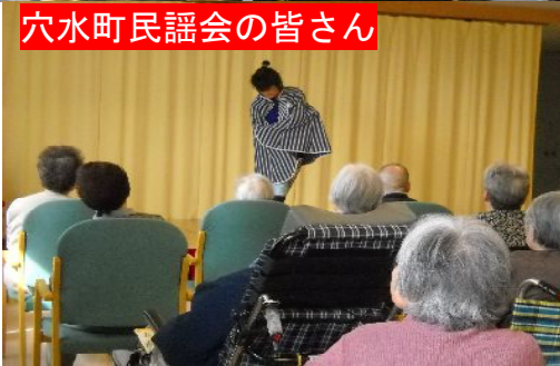
穴水町民謡会の皆さん