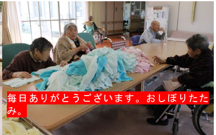
毎日ありがとうございます。おしほりたたみ。