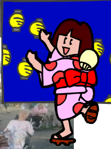
～ 箸匠倶楽部 様 より～