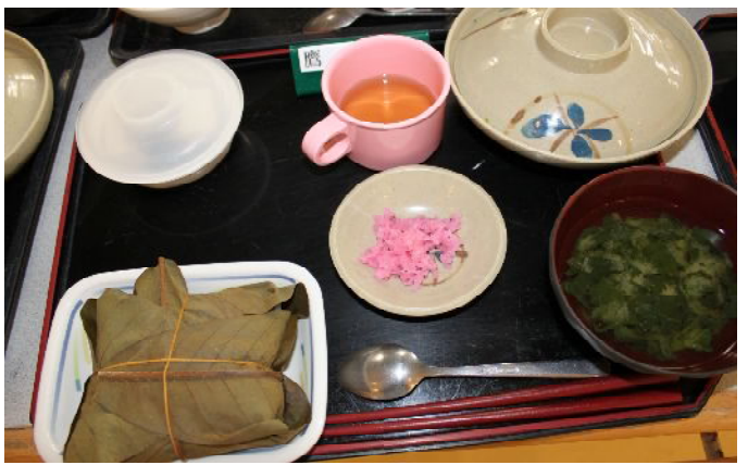
～国際ソロプチミスト輪島 様より～